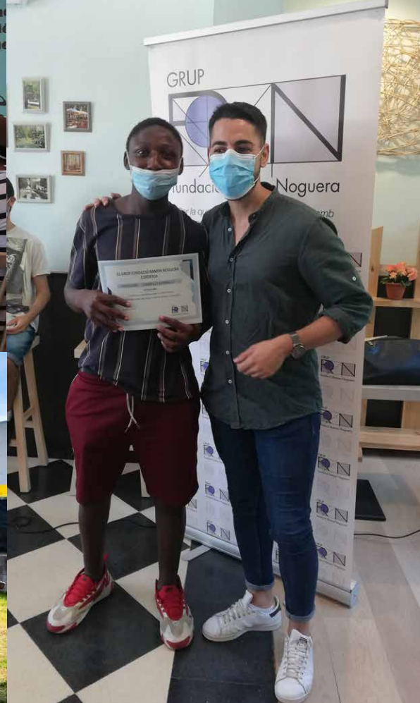
En Yougujasse recollint el seu diploma