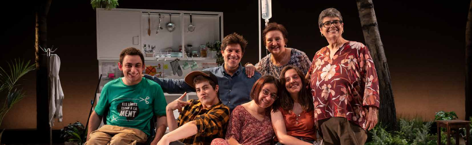
Tot l'equip d'actors i actrius de l'espectacle "Mare de Sucre", en una foto oficial de l'obra al TNC