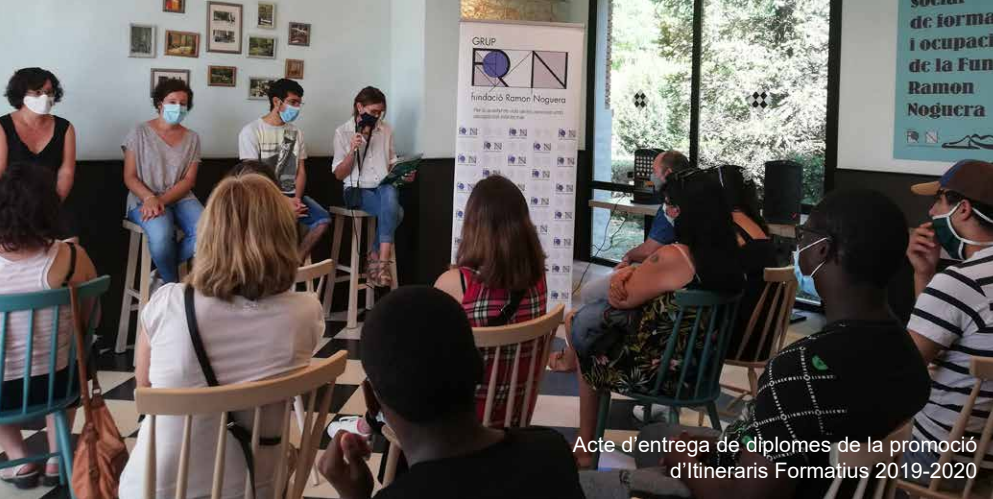
Acte d'entrega de diplomes de la promoció d'Itineraris Formatius 2019-2020