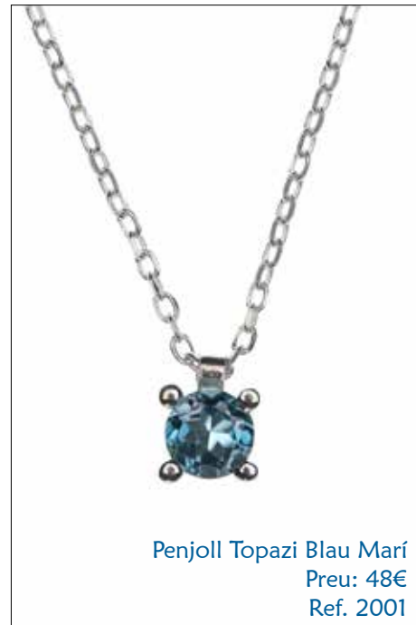
Penjoll Topazi Blau Marí Preu: 48€ Ref. 2001

Mariona Quera s'ha inspirat en aquesta lluminosa estança ornamentada amb mobiliari de plata. La llum entra per 17 finestrals i es reflecteix als 357 miralls que la formen, i això és el que representen les peces de la col·lecció Versalles. Es tracta d'un penjoll curt i d'unes arracades de botó tot en plata de llei amb incrustació d'una pedra semi-preciosa, a triar entre ametista, topazi blau marí o topazi blau cel.