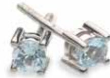
Arracades Topazi Blau Cel Preu: 45€ Ref. 2004