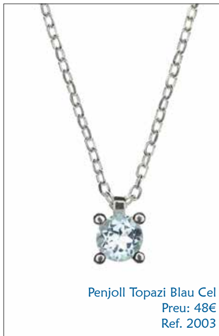
Penjoll Topazi Blau Cel Preu: 48€ Ref. 2003