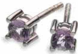
Arracades Ametista Preu: 45€ Ref. 2006