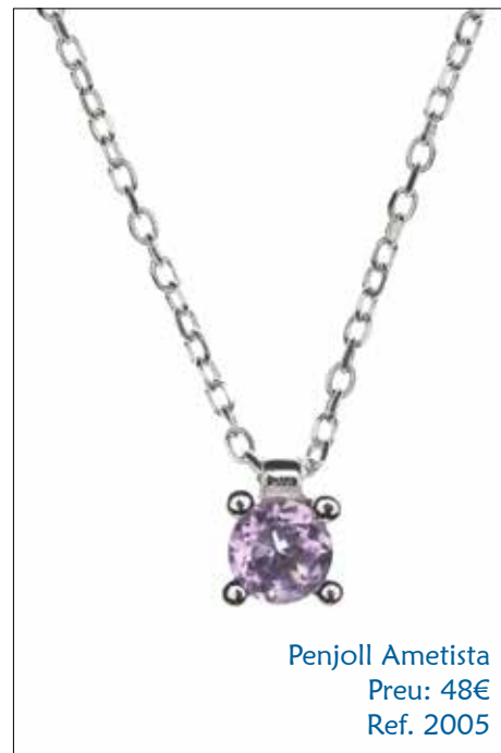
Penjoll Ametista Preu: 48€ Ref. 2005