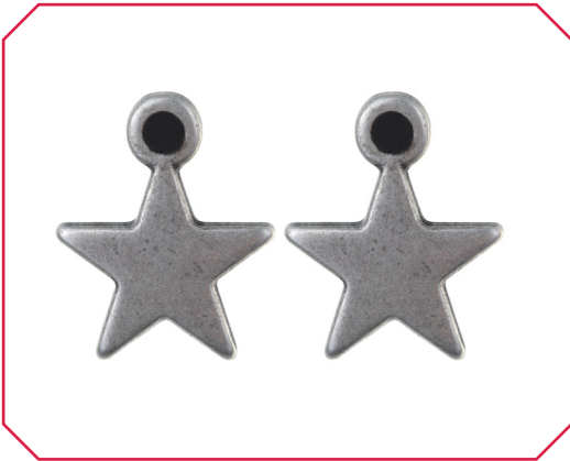
Arracades Berlín Estrella