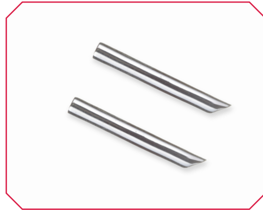
Arracades Kyoto Bambú