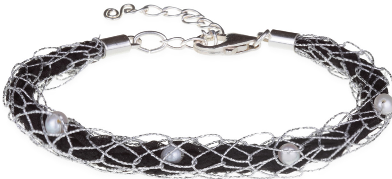
Braçalet París Nit