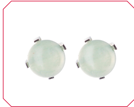
Arracades Viena botó