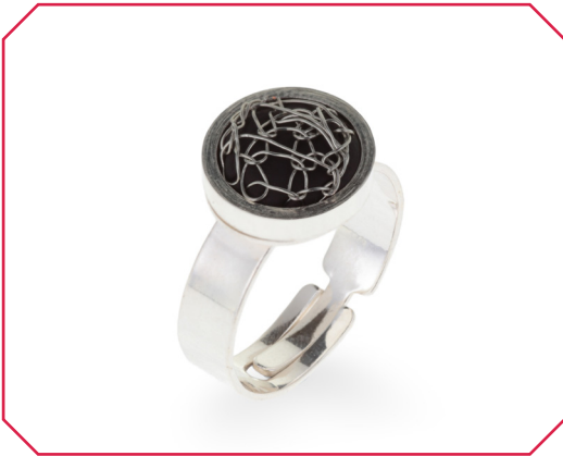
Anell París Nit