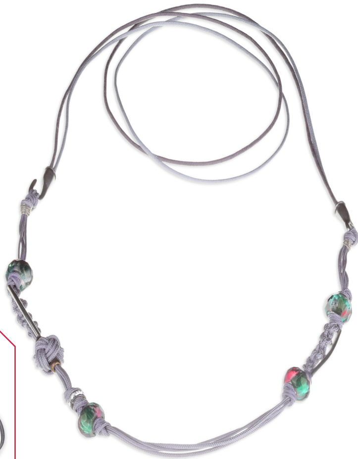
Collaret Istanbul , model llarg i model curt