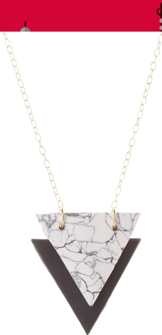
Penjoll Luxor , model llarg i model curt