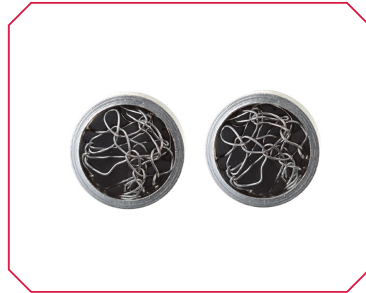
Arracades París Nit